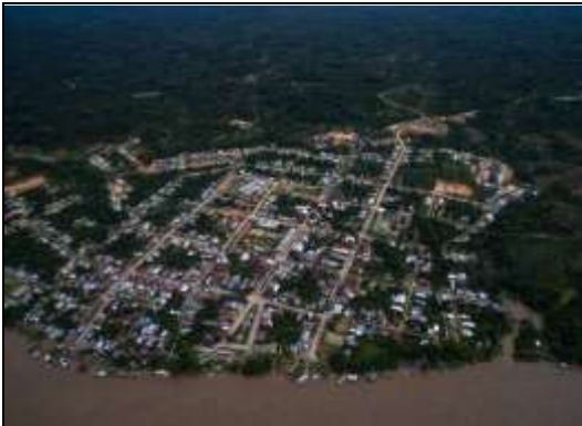
Foto panorámica de Tamshiyacu