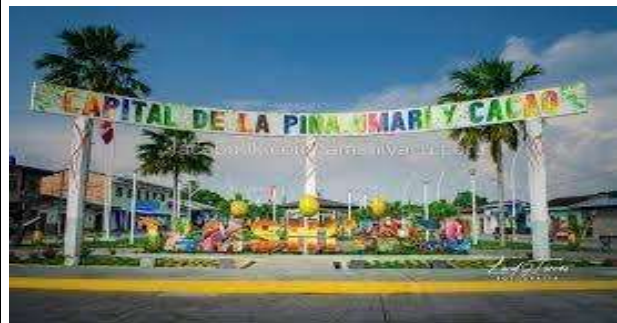
Foto de Plaza de Tamshiyacu