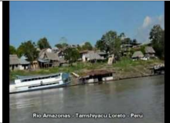
Rio Amazonas - Tamshiyacu Loreto - Peru