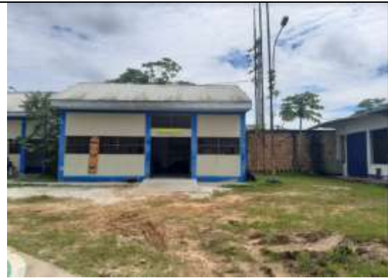
Foto del Almacenamiento de la Central Térmica