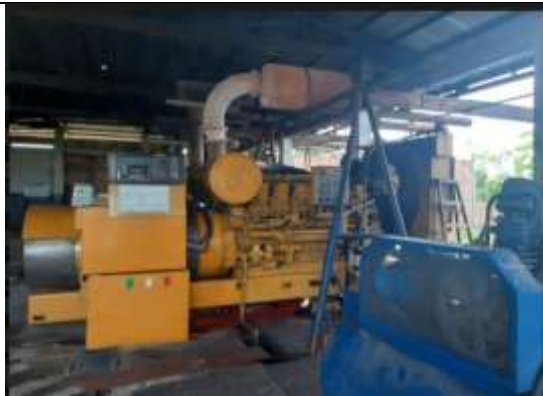
Foto de Motor Eléctrico de la Central Térmica