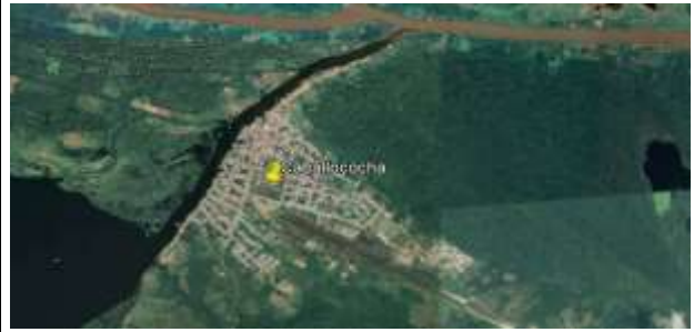
Vista de Nauta