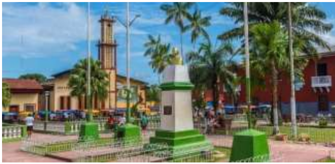
Foto de Plaza de Armas de Nauta