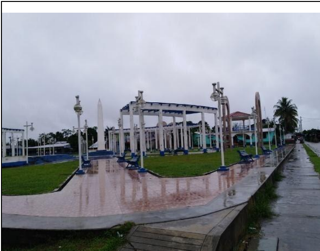
Foto de la plaza de El Estrecho