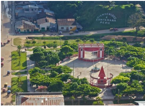
Imagen de plaza de Contamana