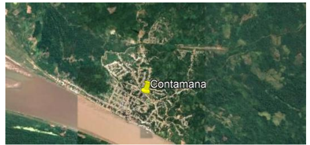
Vista de Contamana