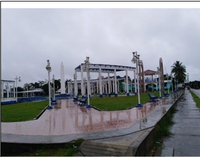
Foto de la plaza de El Estrecho