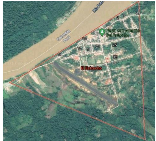
Vista de El Estrecho