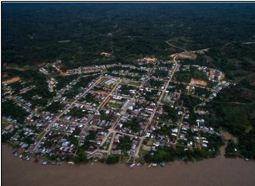
Foto panorámica de Tamshiyacu