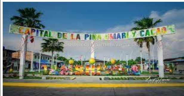
Foto de Plaza de Tamshiyacu