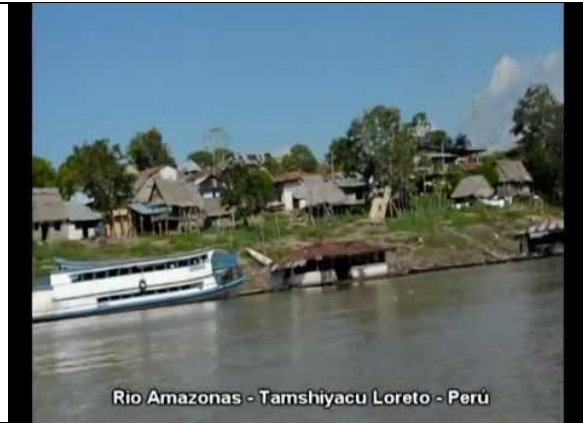
Rio Amazonas - Tamshiyacu Loreto - Perú