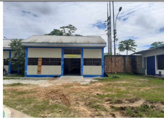
Foto del Almacenamiento de la Central Térmica