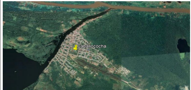
Vista de Nauta