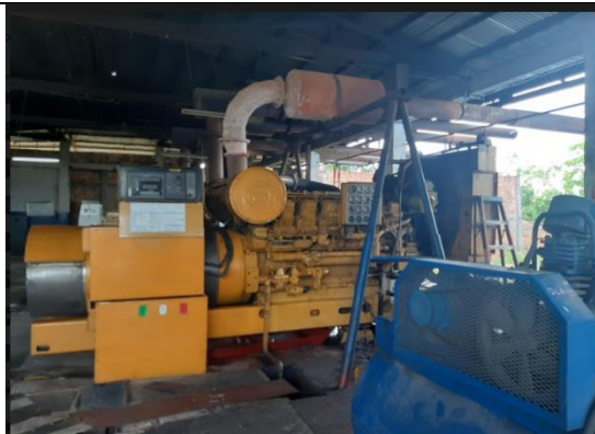
Foto de Motor Eléctrico de la Central Térmica