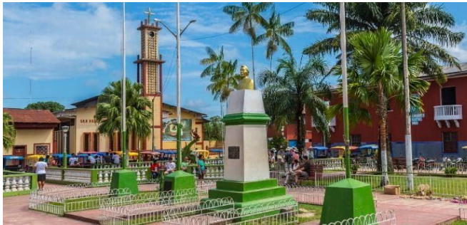
Foto de Plaza de Armas de Nauta